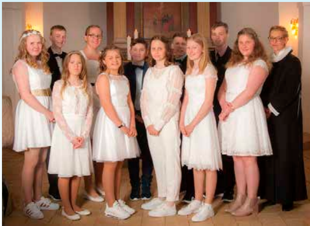
Roager Kirke, Bededag d. 27. april. Konfirmander fra Roager og Spandet: Bagerste række fra venstre mod højre: