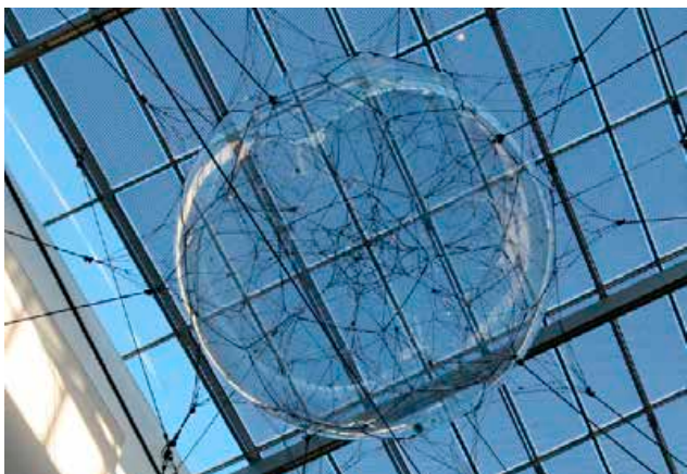
Tomás Saraceno (1973- ), Biosfærer, 2009. Statens Museum for Kunst © kunstneren