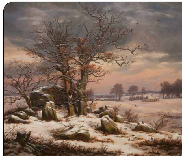
Johan Christian Dahl (1788-1857), Vinterlandskab. Nær Vordingborg, 1827