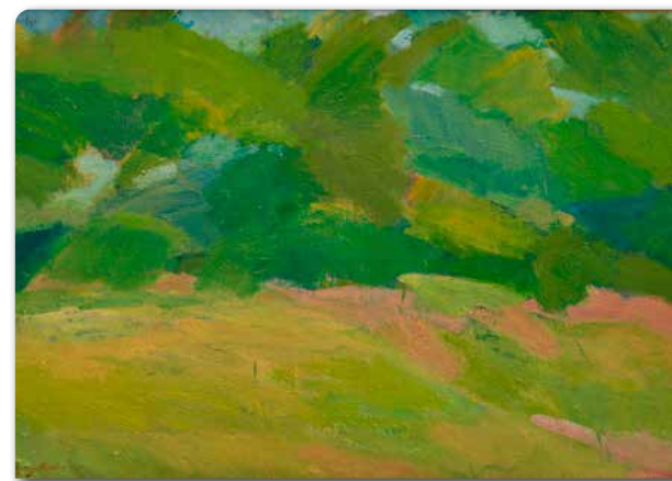
Georg Glud, Havebillede 1947 Statens Museum for Kunst, www.smk.dk , public domain.